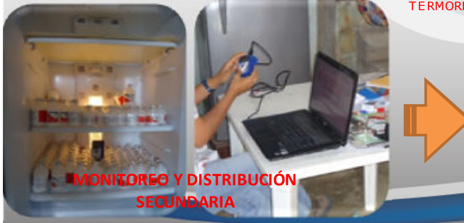
MONITOREO Y DISTRIBUCIÓN SECUNDARIA