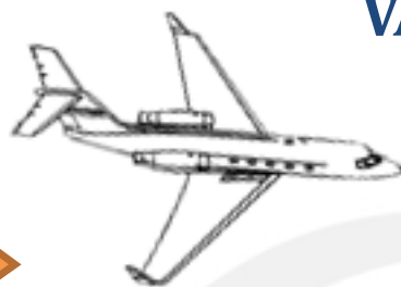
TRASLADO A ECUADOR