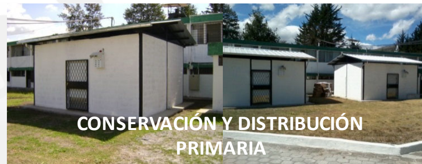
CONSERVACIÓN Y DISTRIBUCIÓN PRIMARIA