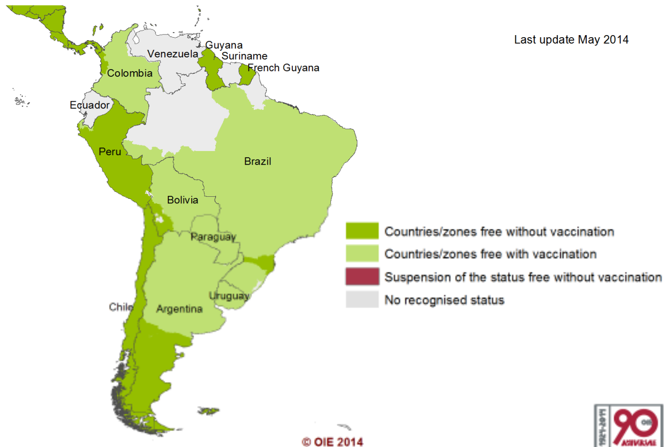
SOUTH AMERICA: OIE Member Countries' official FMD status map