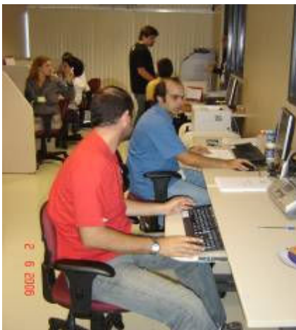
Sala de Comando